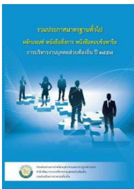
หนังสือ หลักเกณฑ์ หนังสือสั่งการ หนังสือตอบข้อหารือ การบริหารงานบุคคลส่วนท้องถิ่น ปี ๒๕๕๗