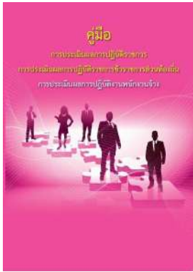
หนังสือ การประเมินผลการปฏิบัติงานพนักงานจ้าง