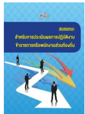
หนังสือ สมรรถนะสำหรับการประเมินผลการปฏิบัติงาน ข้าราชการหรือพนักงานส่วนท้องถิ่น