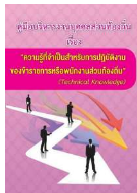
หนังสือ ความรู้ที่จำเป็นสำหรับการปฏิบัติงาน ของข้าราชการหรือพนักงานส่วนท้องถิ่น