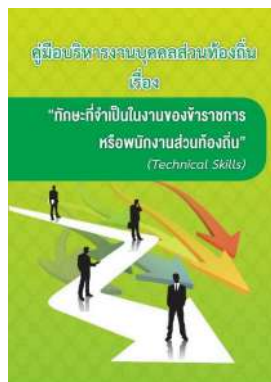
หนังสือ ทักษะที่จำเป็นในงานของข้าราชการ หรือพนักงานส่วนท้องถิ่น