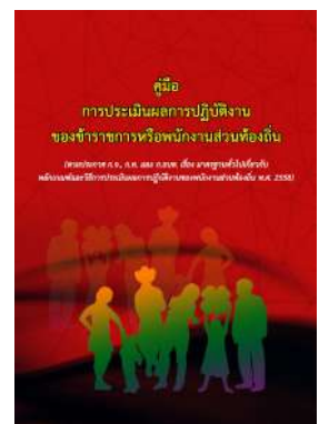
หนังสือ การประเมินผลการปฏิบัติงาน ของข้าราชการหรือพนักงานส่วนท้องถิ่น