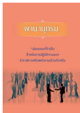
หนังสือ สมรรถนะที่จำเป็นสำหรับการปฏิบัติงานของ ข้าราชการหรือพนักงานส่วนท้องถิ่น