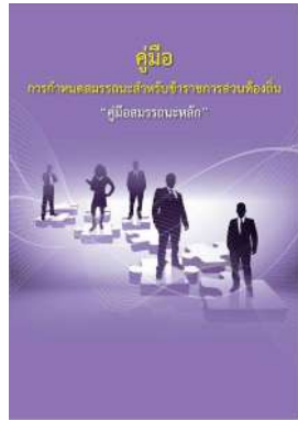
หนังสือ สมรรถะหลัก