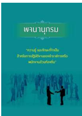
หนังสือ ความรู้ และทักษะที่จำเป็น สำหรับการปฏิบัติ งานของข้าราชการหรือพนักงานส่วนท้องถิ่น