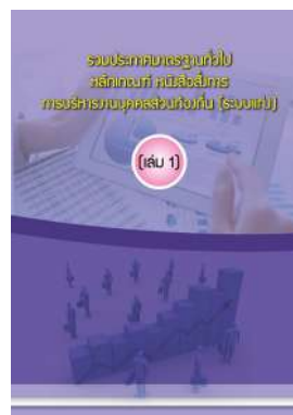
หนังสือ รวมประกาศมาตรฐานทั่วไป หลักเกณฑ์ หนังสือสั่งการ การบริหารงานบุคคลส่วนท้องถิ่น